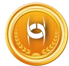
1. místo Autopojištění

ČPP v roce 2022 zabodovala v prestižní anketě Pojišťovna roku, kde o vítězích hlasují profesionální pojišťovací makléři. Dvě zlaté medaile získala v kategoriích Autopojištění a Pojištění občanů. K tomu přidala dvě druhá místa v kategoriích Pojištění průmyslu a podnikatelů a Životní pojištění.