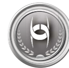
2. místo Pojištění průmyslu a podnikatelů