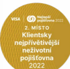
2. MÍSTO Klientsky nejprívětivější neživotní pojišťovna 2022