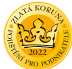
1. místo Pojištění podnikatelů a průmyslu

V jubilejním 20. ročníku soutěže Zlatá koruna získala ČPP celkem tři ocenění. Obhájila zlato za Pojištění podnikatelů a průmyslu a také stříbro za produkt Autopojištění COMBI PLUS IV. Navíc se umístila v kategorii životního pojištění na bronzové příčce s produktem NEON LIFE.