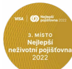
3. MÍSTO Nejlepší neživotní pojišťovna 2022

Ve 14. ročníku soutěže Nejlepší pojišťovna vyhlášené deníkem Hospodářské noviny obdržela ČPP druhé místo v kategorii Klientsky nejprívětivější neživotní pojišťovna a z předchozího roku obhájila třetí pozici v kategorii Nejlepší neživotní pojišťovna.