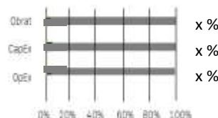
2. Soulad investic s taxonomií, bez státních dluhopisů*

V souladu s taxonomií: (Bez plynu a jaderné energie) V souladu s taxonomií: Jaderná energie V souladu s taxonomií: Fosilní plyn Nesoulad s taxonomií